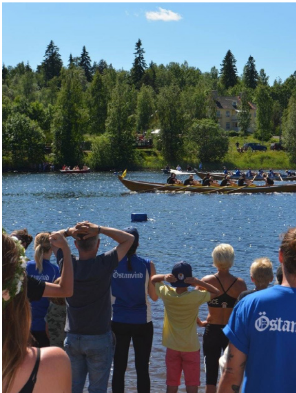
Målgång under Svärdsjöcupen 2016

Det var 5 st tävlingar, fördelat på följande platser, Svärdsjön 3 st, Hedkarlsjön 1 st och 1 st på Toftan. Längsta distansen är på 1800 m och kortaste är 800 m. Det har varit fyra damlag och tre herrlag i årets cup. Båtarna som tävlade har varit Skryt´n, Stinan, Toft´n och Östanvind. Kyrkbåtarna är 11,40 m långa och besättningen består av 10 st roddare samt styrman/kvinna.