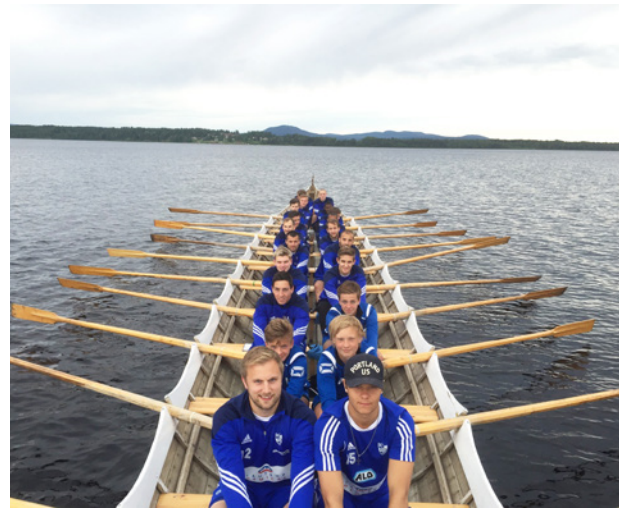
Fotbollslaget i IFK Mora ror kyrkbåt

Det har varit ”provapårodd” när skolorna startat upp efter sommarlovet eller inför sommarens ledighet med årskurserna 7-9 samt gymnasierna. Förutom de träningar som genomförts inför sommarens tävlingar har det funnits möjlighet för motionsträningar med blandade åldrar för de som valde att avstå tävlandet. Olika utflyktsmål har också funnits med som inslag i motionsträningarna.