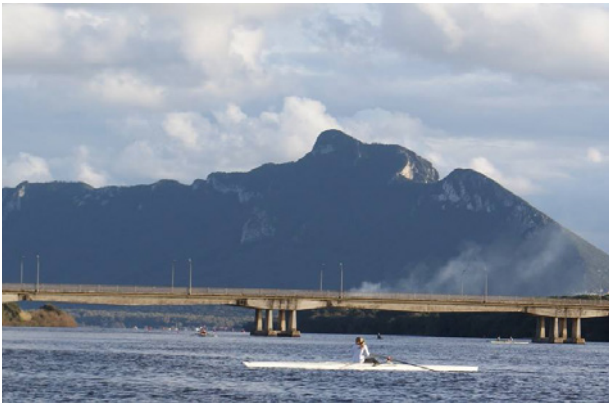
Roddvattnet i Sabaudia.

Sabaudia igen 3 veckor tillsammans med utmanargruppen. Även här var Valery Kleschnev med och gjorde biomekaniska mätningar. Riktigt roligt att tillhöra en stor grupp med en härlig stämning. Flera fina prestationer av utmanarna som lovade mer under säsongen.