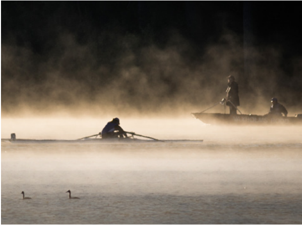
Domarbåt under SM vid Magelungen.

Domare med FISA licens har under säsongen 2016 deltagit vid följande internationella regattor och mästerskap: