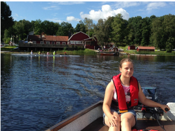
Ungdomar på Åkulla 2016

Två veckor efter var det dags för Åhus Hamnregatta att ta emot våra ungdoms- och juniorroddare. Här deltog roddare från Norrtälje, västkusten och södra delarna av Sverige.