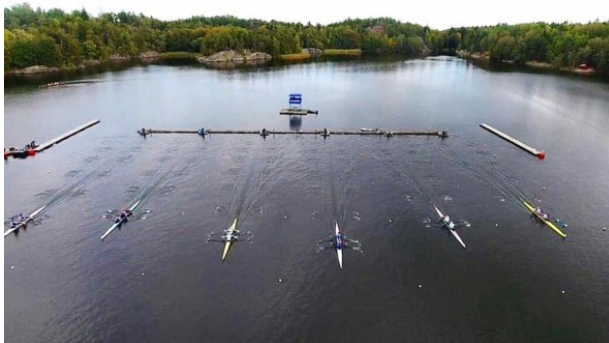
SM Flygbild

inte arrangera tävlingen under kommande år. Sorgligt, då många svenska roddare har introducerats till tävlingsrodd i Åkulla. Ett stort tack går till arrangören som under decennier skapat en mötesplats för unga roddare.