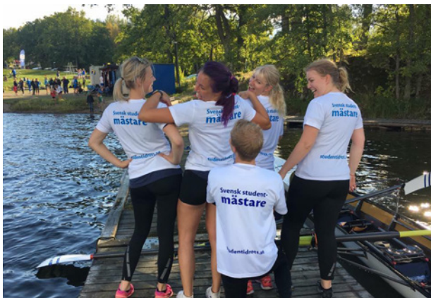
Studentrodd-SM, Magelungen 2016

Vid årets Student SM deltog lag från Jönköping (JURA), Lund (LURK), Stockholm (KI och KTH) samt Uppsala (UARS). För att räknas som Student SM krävs deltagande från fyra högskolor eller universitet. Detta uppfylldes, då det gällde loppet för damer och mixed, där JURA respektive KTH segrade. Prisutdelare var Cecilia Västgård från SAIF. Tävlingen gav mersmak och inför 2017 planeras ett motsvarande Student SM i Vaxholm den 3 september.