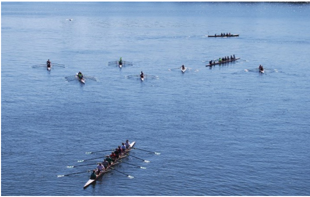
Fotografering vid Lilla Essingen, nästan alla båtar på plats.

på pastasallad och fika där ca 55 st Hammarbyare deltog.