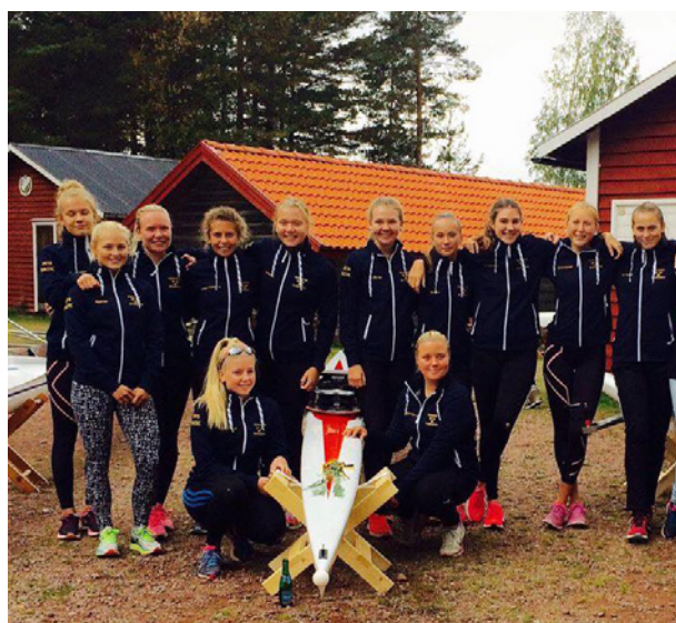
Juniordamerna på läger i Sollerön

Baltic Cup Hamburg 30 sept–20 oktober: Deltog med 27 aktiva, 12 damer och 15 herrar. Härlig trupp med bra stämning, Sverige fick totalt en 4:e plats i nationalskampen. Guld i 2x med Alice Ekros/Elin Lindroth på 2000m samt 500m och ett brons i 1x med Mattias Nilsson på 500m. Också roligt att se en svensk dam 4 tävla.