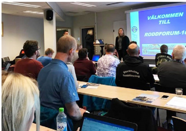
Roddforum, nov 2016

Dessa ord visar att vi kommit långt i vårt arbete att gå från triangel till rektangel, att skapa livslångt idrottande, och att vi troligtvis har haft det inom oss från start. Vi vet att rodd är en fantastisk idrott som vi utför i härlig natur för både träning och rekreation. Mångfalden i våra olika former av rodd, såsom kustrodd, långfärdsrodd, kyrkbåtsrodd, tiohuggare, modern tävlingsrodd, inomhusrodd skapar förutsättningar för en bred publik. Gemenskapen och glädjen som finns i denna miljö får oss att må bra och lockar oss till fortsatt deltagande. Jag säger det i år igen, detta behöver vi bli bättre på att marknadsföra oss med.