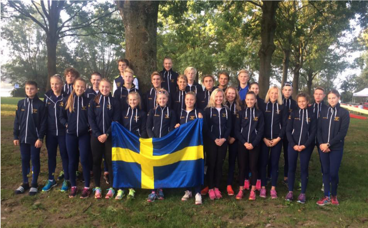
Truppen som deltog på Baltic Cup 2016

på förmiddagen samt olika alternativa träningsformer på eftermiddagen. De aktiva fick även utbildning i träningsrapportering, teambildning samt under hela lägertiden hade de olika gruppövningar. Bra boende och mat på Moskogens hotell.