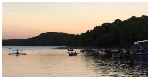
Roddare på vattnet vid evenemanget Musik på vattnet i Mölndal.

MRK brukar också ordna aktiviteter på Rådasjöns dag vid handikappbadet. Där visar de att rodd är en idrott för unga, gamla, rörelsehindrade, synskadade, för alla helt enkelt. De unga roddskoleledarna och roddskoleeleverna tar med alla som vill prova på rodd ut på vattnet. MRK firar roddskoleavslutning med grillning för deltagare, ledare och