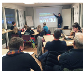
Utvecklingsträff i Sundsvall 2016

Från september 2015 och till december 2016 har projektet arrangerat 16 Utvecklingsträffar där 40 av våra 62 aktiva föreningar har deltagit. Processer har även hållits under de tre RODDForum som genomförts samt under förbundsmöteshelgen i mars. Det som framkom på dessa träffar samt i övriga enkäter och processer som varit inom projektet har mynnat ut i sex åtgärdsområden som arbetats med under 2016 och även fortsättningsvis kommer arbetas med under 2017. Allt detta går det att läsa mer om på rodd.se/barnungdom/svenskrodd2020 .