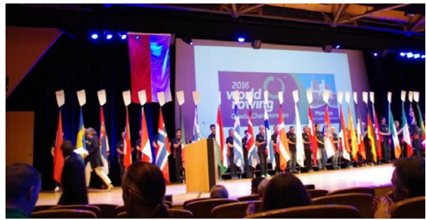
Invigning, kustrodds-VM