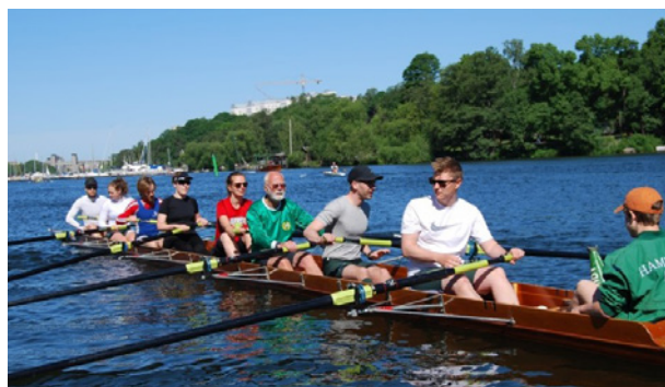
En mix-åtta redo att börja ro.

Målet är att få alla ut alla lagbåtar på vattnet. Totalt var det 41 roddare och 3 styrmän på vattnet i år, med fördelningen av 21 män och 23 kvinnor. Det var åttor, scullerfyror, enkelårsfyra, inriggare, dubblar och även en kustroddbåt i helt mixade besättningar. Åldrarna på deltagarna var mycket varierande,