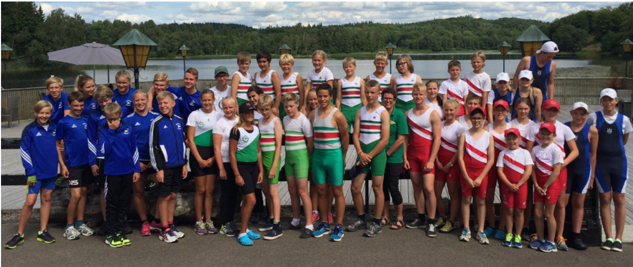
Deltagare under Åkullaläget 2016