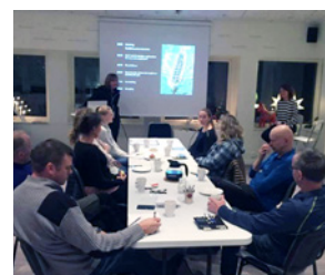
Utvecklingsträff i Leksand 2016

Det har varit en både givande och ROLIG tid på förbundet med många givande och inspirerande möten med föreningar. Mycket bra och viktigt händer inom svensk rodd för att skapa roddverksamhet på barn och ungas villkor! Vi har en del att bearbeta för att bli en idrott som välkomnar alla så att ingen exkluderas. Vi behöver jobba med denna kulturförändring, både internt och externt. Alla grenar i alla landets roddföreningar skall bli inkluderade och hörda lika mycket. Detta vill vi, med största respekt, lyfta och å det varmaste bjuda in till att vi alla vågar synliggöra och diskutera. Hela Svensk Idrott, med alla 71 förbunden, gör en riktningförändring i och med strategi 2025 i arbetet med att gå från triangel till rektangel. Detta påverkar inte bara stimulansprojektet #svenskrodd 2020 – barn och ungdom, utan detta ska genomsyra hela Svenska Roddförbundets arbete och fokusering.