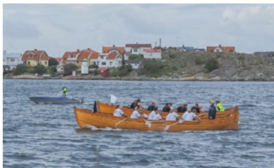
Tiohuggare SM 2016

Inomhusrodd, Svenska Mästare koras i senior och Junior A klasser övriga är Förbundsmästerskap