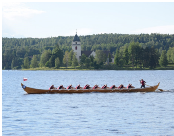
Orsa Roddklubb på kyrkbåttävling i Rättvik.

Kapprodd med Kyrkbåtar har bedrivits på Siljan sedan 1936 och det var Leksandsrodden som var först ut med att arrangera kapprodd mellan byarna runt Siljan. Siljansrodden har bestått av 6 st deltävlingar och genomfördes i år för 42:a gången och Leksandsrodden hade jubileumsarrangemang, den genomfördes för 80:e gången denna sommar. Kyrkbåtarna är 18,5 m långa och besättningen består av 20 st roddare samt styrman/kvinna.