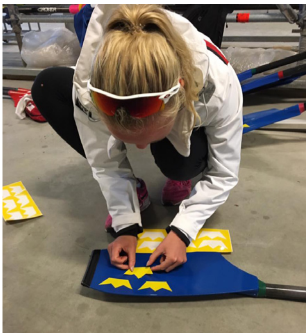
Förberedelser inför VM

Under året har Dubbelsculler Tv Filippi avyttrats. Landslaget har haft nyttjanderätt av Riksidrotts gymnasiets (RIG) båtar: Scullerfyra Tv Filippi Strömstad