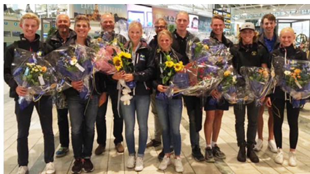
VM-truppen 2016