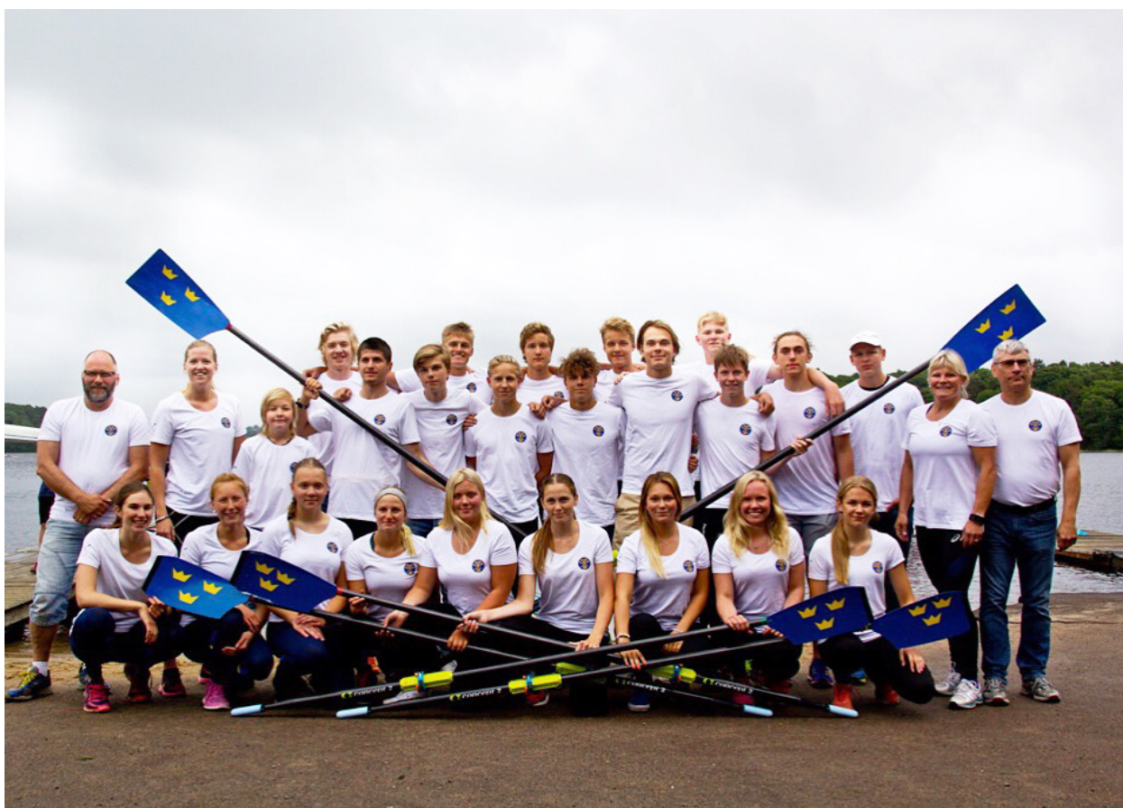
Juniortruppen, JNM Mölndal 2016